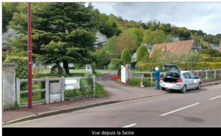
Vue depuis la Seine