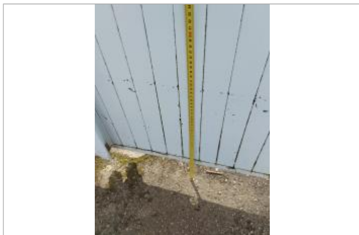
Laisse sur portail à 39cm du sol

NIVELLEMENT DU SPC/SACN. LE SPC N'EST PAS GÉOMÈTRE EXPERT, LES COTES SONT DONNÉES À TITRE INDICATIF. - 21/06/2024