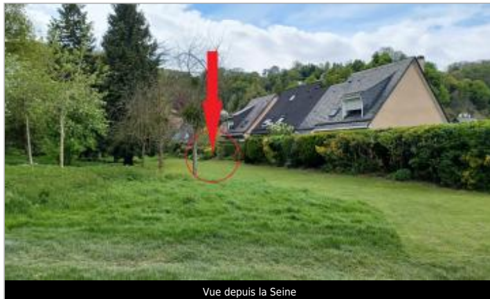
Vue depuis la Seine