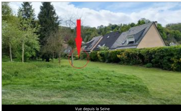
Vue depuis la Seine