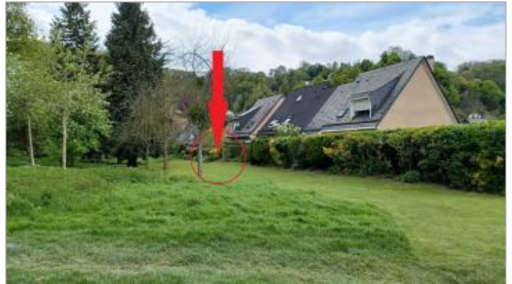
Vue depuis la Seine

Coordonnées WGS84 : X: 0.93607371 / Y: 49.35020820