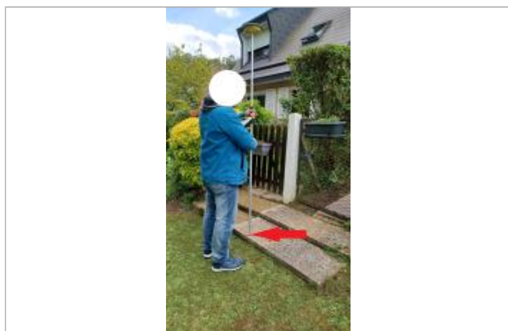
Laisse au sol sur la première marche.