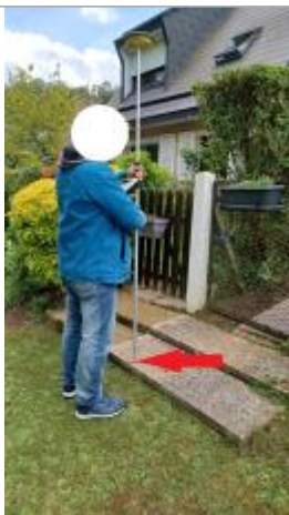
Laisse au sol sur la première marche.