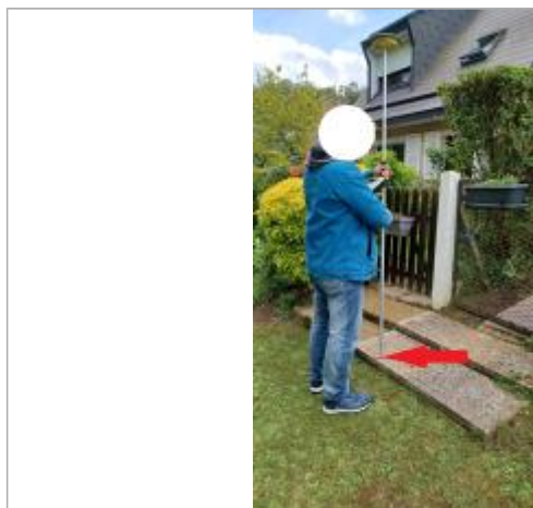
Laisse au sol sur la première marche.