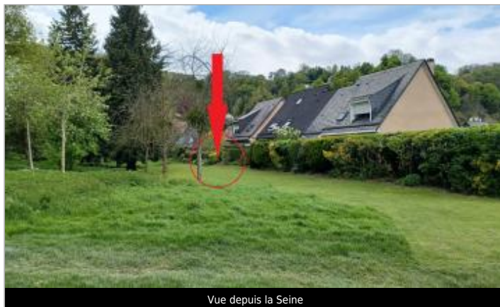
Vue depuis la Seine