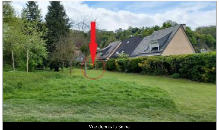
Vue depuis la Seine

Coordonnées WGS84 : X: 0.93607371 / Y: 49.35020820