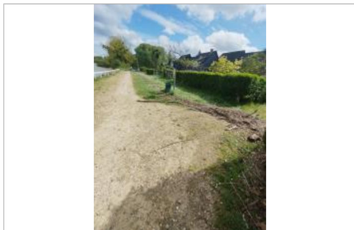
Laisse de végétation au pied de la poubelle fixe

Altitude calculée de l'eau (en m) : 5.16