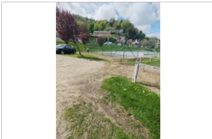
Terrain de tennis communal