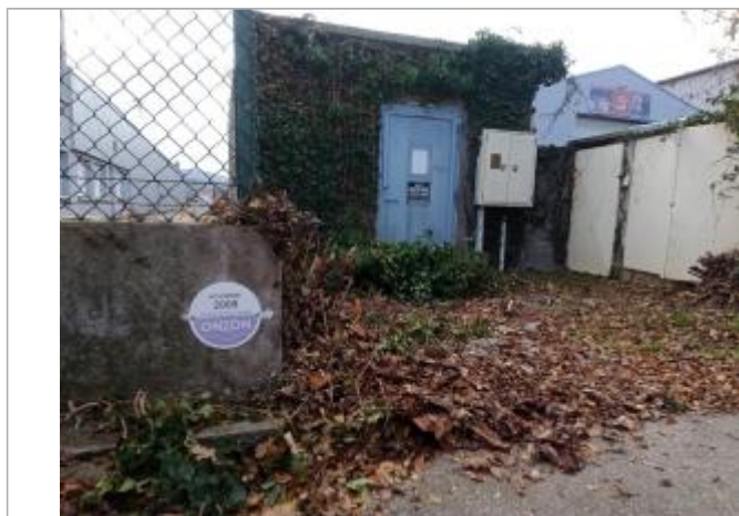
Vue du repère de crues