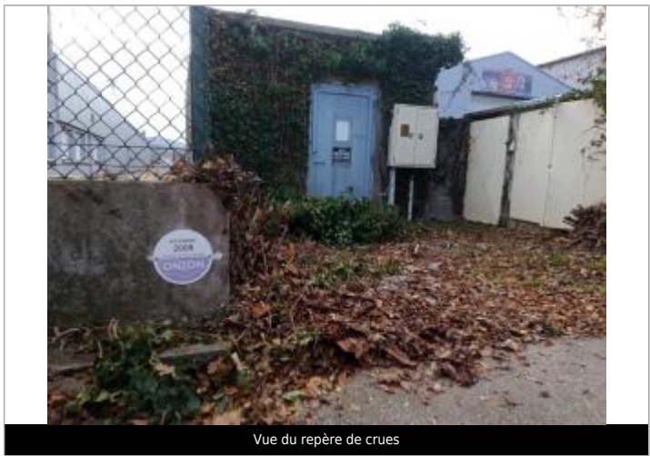
Vue du repère de crues