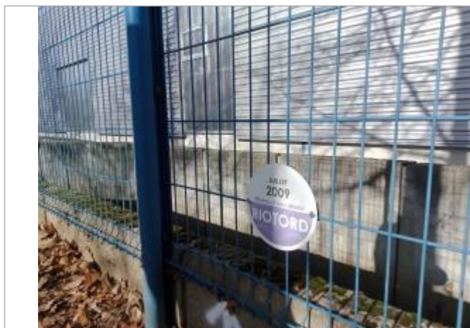
Vue du repère de crues