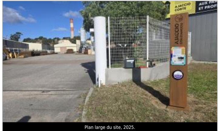
Plan large du site, 2025.