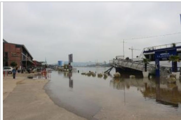
Quai rive droite au hangar 10 (DREAL NORMANDIE)