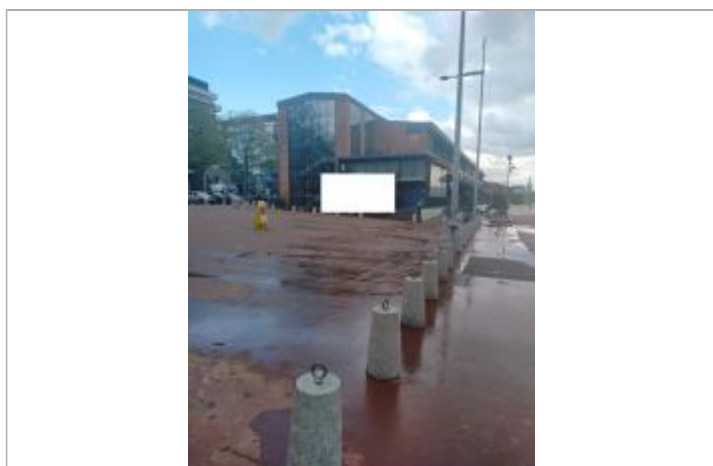
Vue globale sur le sol bitumé des quai proche du hangar 10

NIVELLEMENT DU SPC/SACN. LE SPC N'EST PAS GÉOMÈTRE EXPERT, LES COTES SONT DONNÉES À TITRE INDICATIF. - 30/04/2024