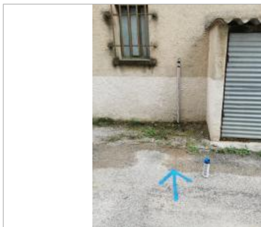
vue de la marque sur la blanchisserie