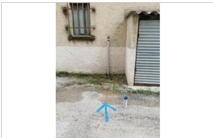
vue de la marque sur la blanchisserie