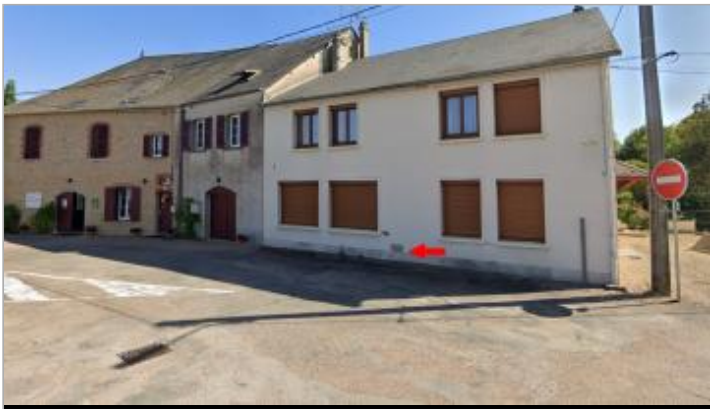
Plaque sur la maison du 1 Place Pierre Saury, en 2024