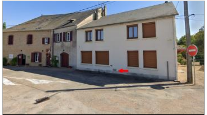
Plaque sur la maison du 1 Place Pierre Saury, en 2024