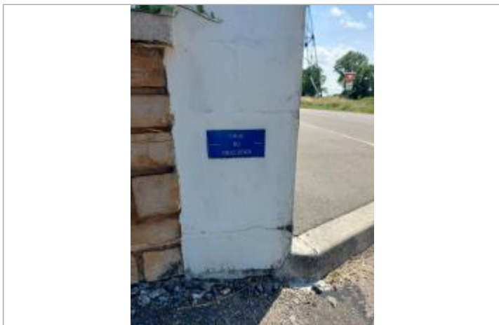
Plaque sur le pilier droit de l'entrée en 2003

MARQUE Texte : Crue du 06.12.2003 Maximum de l'inondation : Oui Visibilité : Oui