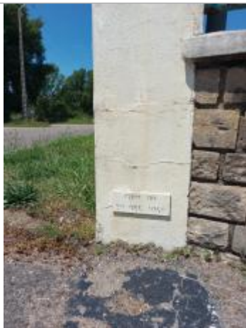
Repère sur pilier à gauche de l'entrée en 2023