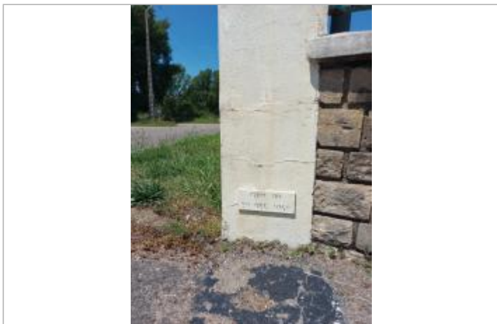
Repère sur pilier à gauche de l'entrée en 2023

MARQUE Texte : Crue du 28 dec 1968 Maximum de l'inondation : Oui Visibilité : Oui