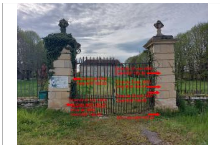
Piliers de la demeure de Mauboux en 2024

GÉOLOCALISATION Coordonnées WGS84 : X: 3.03957253 / Y: 46.79337020 Coordonnées RGF93 (Lambert 93) : X: 703018.48 / Y: 6632582.11 Coordonnées RGF93 (ETRS89) : X: 3.0395725 / Y: 46.7933702 Code Hydro: K---0080 Rive de référence: Droite