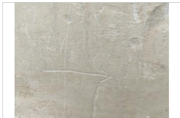
Repère sur pilier de gauche

MARQUE Texte : 27-10-45 Maximum de l'inondation : Oui Visibilité : Oui