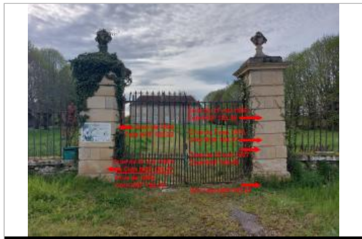
Piliers de la demeure de Mauboux en 2024

GÉOLOCALISATION Coordonnées WGS84 : X: 3.03957253 / Y: 46.79337020 Coordonnées RGF93 (Lambert 93) X: 703018.48 / Y: 6632582.11 Coordonnées RGF93 (ETRS89) : X: 3.0395725 / Y: 46.7933702 Code Hydro: K---0080 Rive de référence: Droite