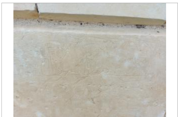
Repère sur pilier de droite

RELEVÉ AU GPS - 05/04/2024 Méthode : GPS Référence nivelée : Marque d'inondation Système altimétrique : NGF IGN 1969 (système normal) Altitude de la référence (en m) : 184.970 m Différence entre le niveau d'eau et la référence (en m) : 0.000 m Altitude calculée de l'eau (en m) : 184.97 m