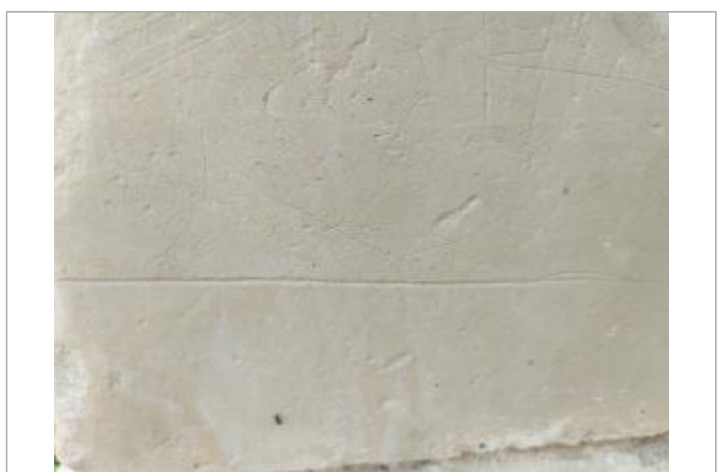
Sur le pilier de gauche (mois illisible)

MARQUE Texte : 20 1862 Maximum de l'inondation : Oui Visibilité : Oui