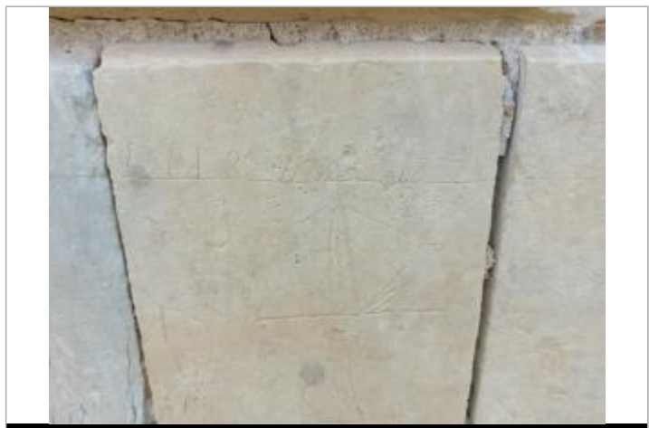
Repère sur le pilier de droite. Cote NGF 184.68

MARQUE Texte : 22 May 1827 Visibilité : Oui