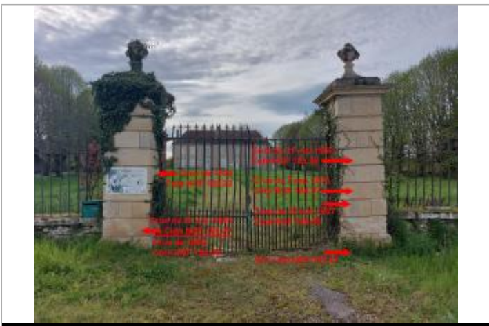
Piliers de la demeure de Mauboux en 2024

GÉOLOCALISATION Coordonnées WGS84 : X: 3.03957253 / Y: 46.79337020 Coordonnées RGF93 (Lambert 93) X: 703018.48 / Y: 6632582.11 Coordonnées RGF93 (ETRS89) : X: 3.0395725 / Y: 46.7933702 Code Hydro: K---0080 Rive de référence: Droite