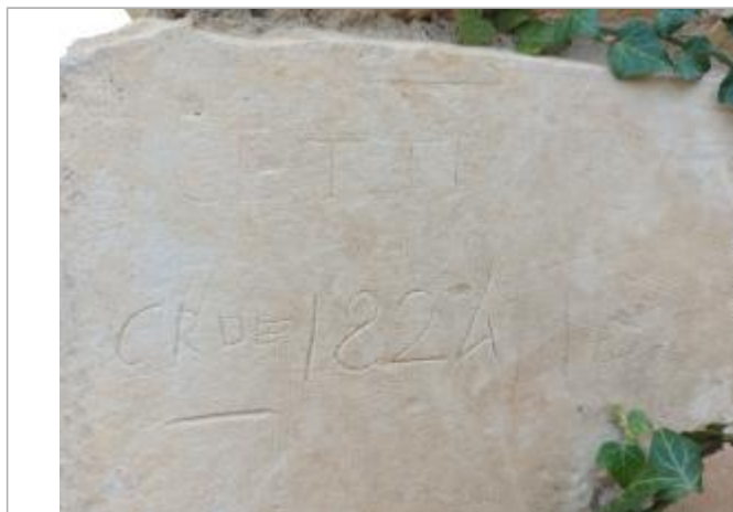
Sur le pilier gauche