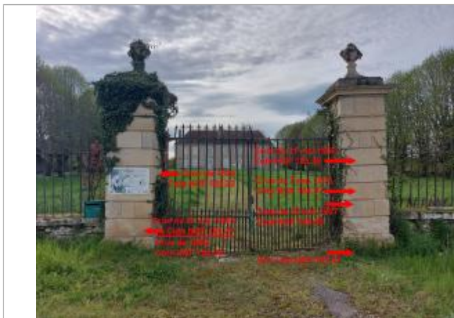
Piliers de la demeure de Mauboux en 2024

Coordonnées WGS84 : X: 3.03957253 / Y: 46.79337020