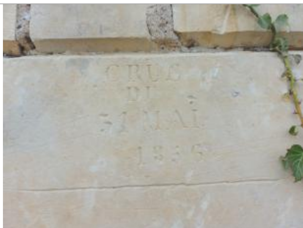
Repère de crue sur le pilier de droite

Altitude calculée de l'eau (en m) : 185.56 m