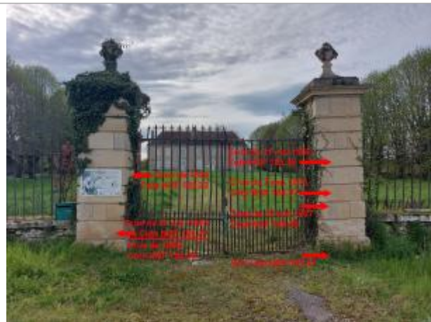
Piliers de la demeure de Mauboux en 2024

Coordonnées WGS84 : X: 3.03957253 / Y: 46.79337020