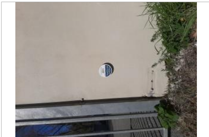
Repère posé à l'entrée