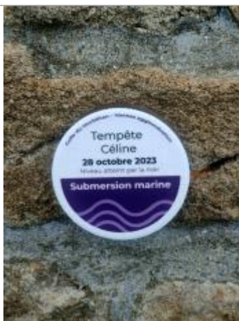
Repère de submersion - Tempête Céline 28 octobre 2023

Texte : Tempête Céline - 28 octobre 2023