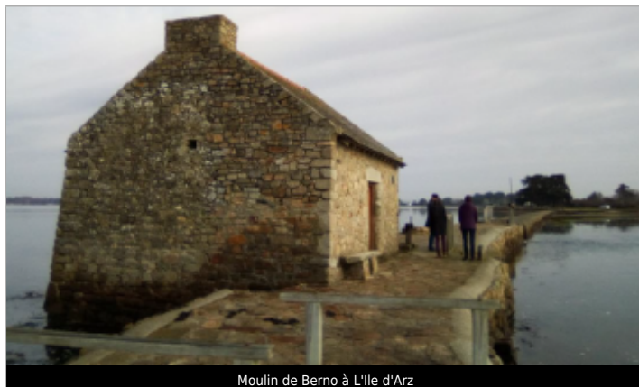
Moulin de Berno à L'ile d'Arz

Coordonnées WGS84 : X: -2.80497070 / Y: 47.59654690