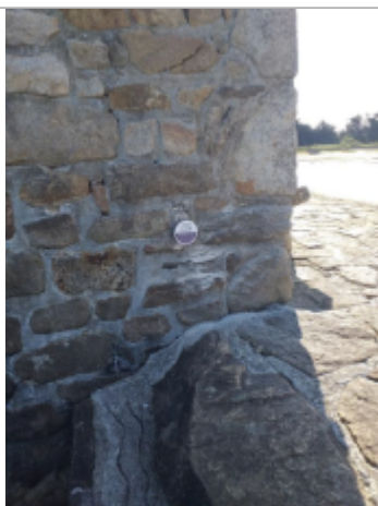
Moulin du Berno