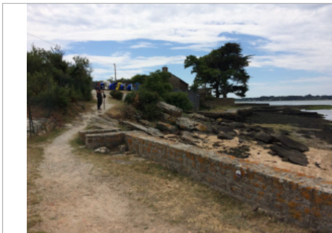
Muret port du Parun

Coordonnées WGS84 : X: -2.94971020 / Y: 47.61133420