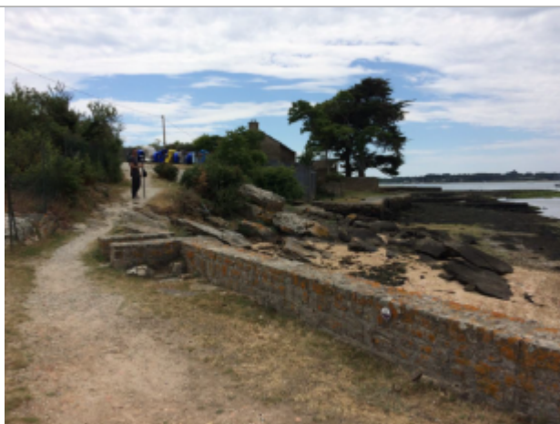
Muret du port du Parun

Altitude calculée de l'eau (en m) : 3.32 m