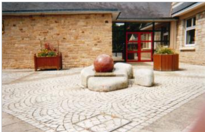
Sculpture devant l'entrée est de la mairie de Saint-Nolff