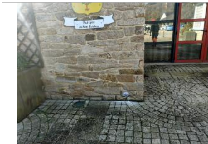
Repère de crue

Type de repérage : Campagne de terrain post-inondation