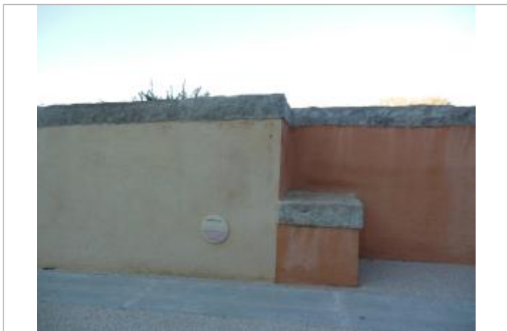
repère sur muret

Texte : 6 novembre 2011 Visibilité : Oui État du repère : Bon Pérennité : Longue