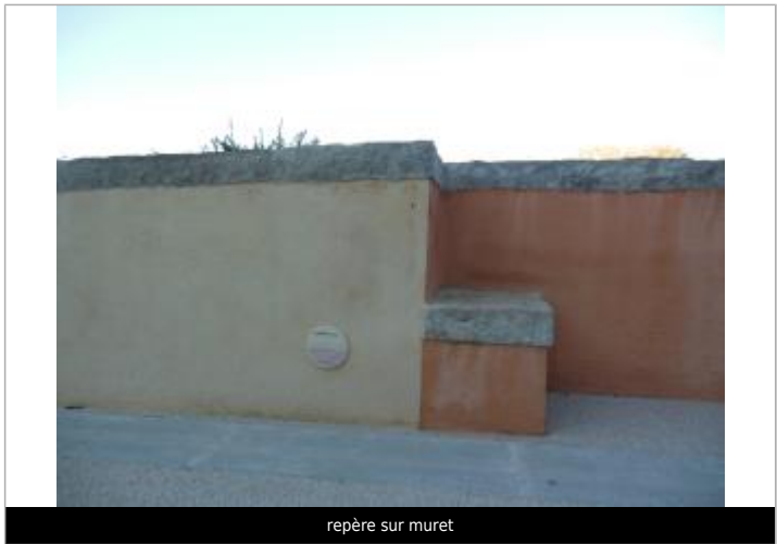
repère sur muret