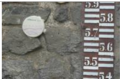
macaron crue 2011