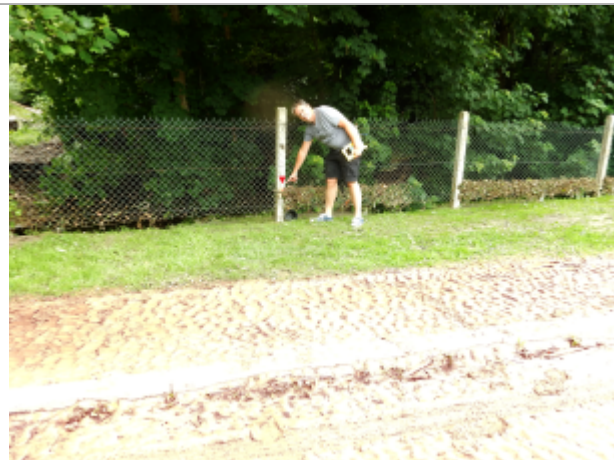
Vue d'ensemble de la clôture du parking