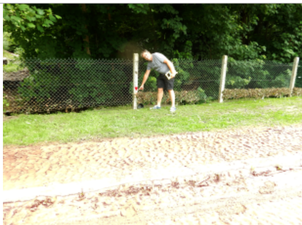
Vue d'ensemble de la clôture du parking

Altitude calculée de l'eau (en m) : 53.67