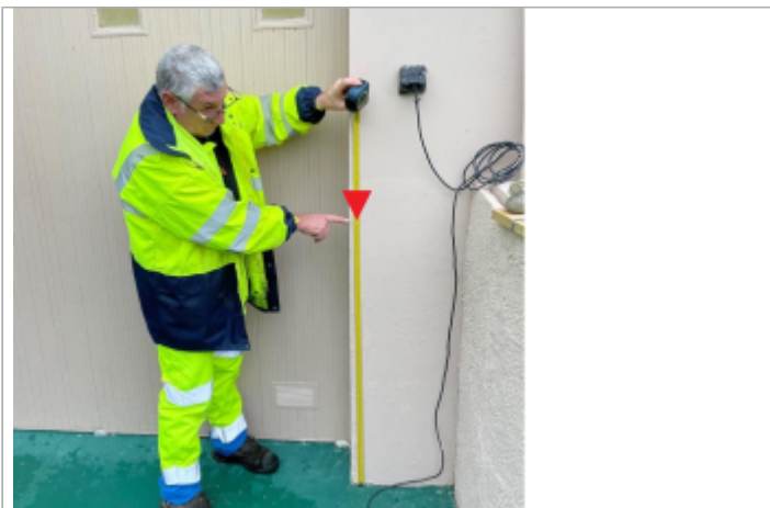
Vue intérieure du garage