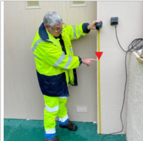
Vue intérieure du garage

Coordonnées WGS84 : X: 0.20566586 / Y: 49.13351840