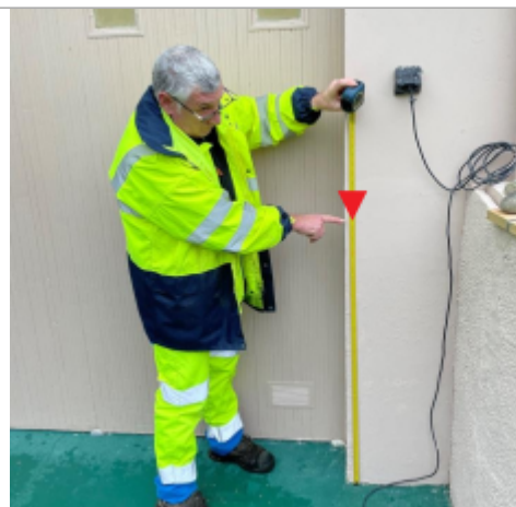
Vue depuis le garage

Altitude calculée de l'eau (en m) : 57.51 m