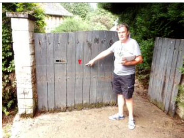
Photo du portail

Altitude calculée de l'eau (en m) : 53.28 m