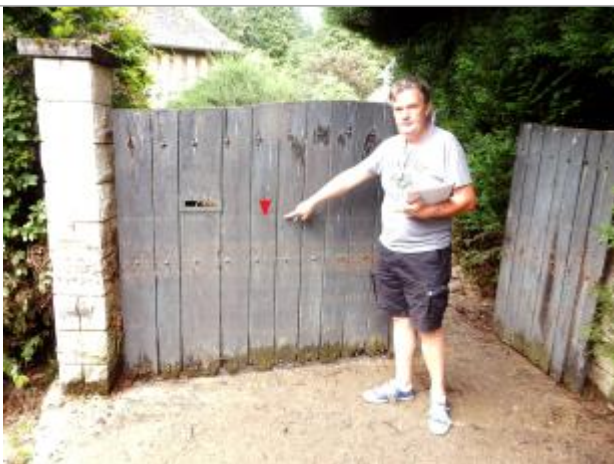
Photo du portail

Altitude calculée de l'eau (en m) : 53.28