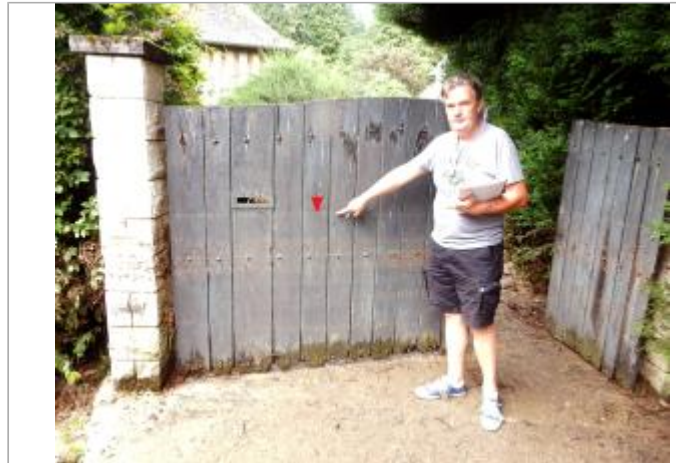
Vue d'ensemble du portail

Coordonnées WGS84 : X: 0.21173670 / Y: 49.14114960