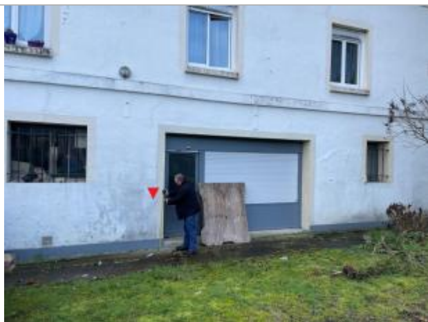
Vue globale de la façade

Altitude calculée de l'eau (en m) : 51.09 m