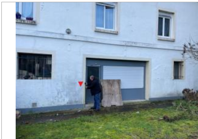
Façade impactée par la crue