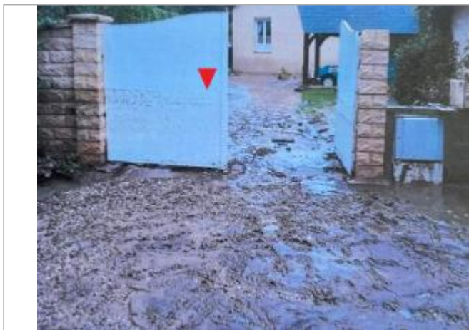
Vue d'ensemble du portail et des piliers