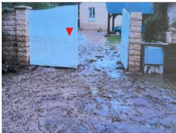
Vue d'ensemble du portail

Altitude calculée de l'eau (en m) : 49.82