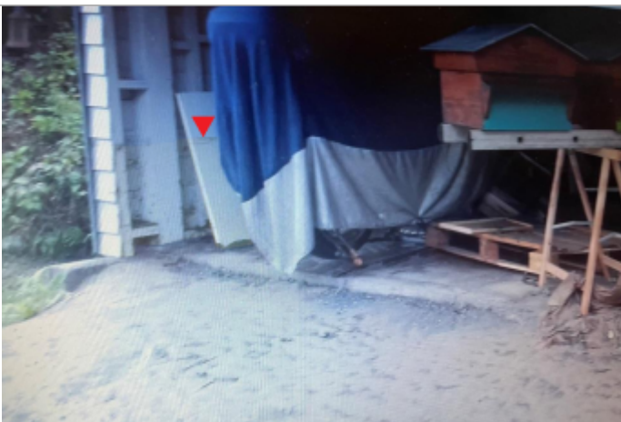
Vue du bâtiment

Altitude calculée de l'eau (en m) : 67.51