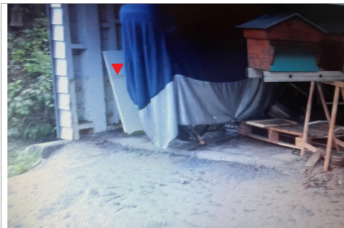
Entrée du bâtiment concerné