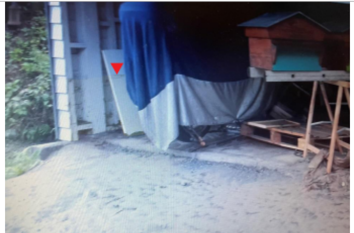
Entrée du bâtiment concerné

Coordonnées WGS84 : X: 0.19735861 / Y: 49.12745380