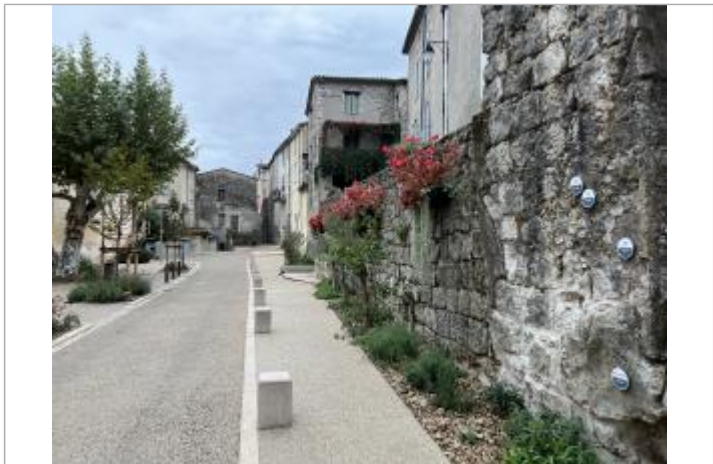
différents repères sur mur