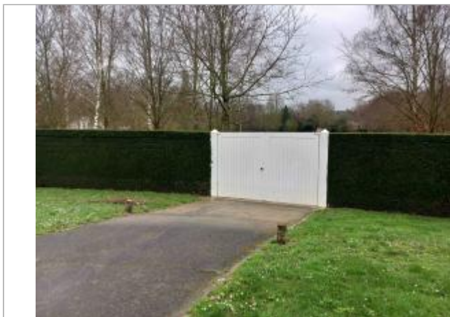
Portail blanc - Accès propriété