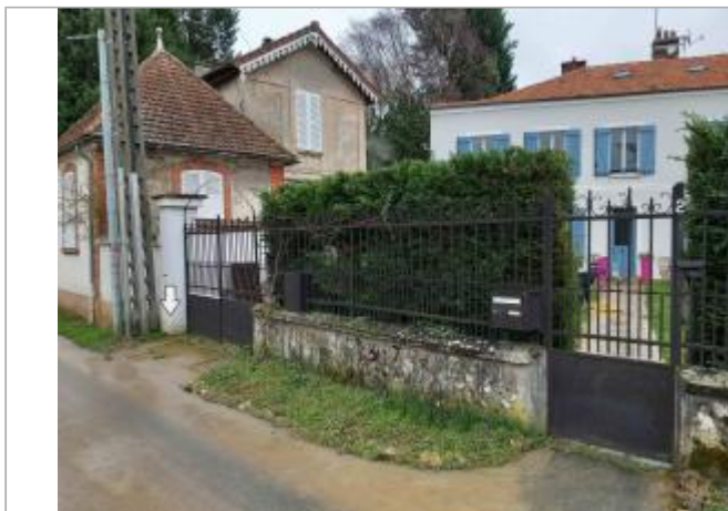
Maison d'habitation - Mesure effectuée au niveau du portail (Poteau béton gauche)