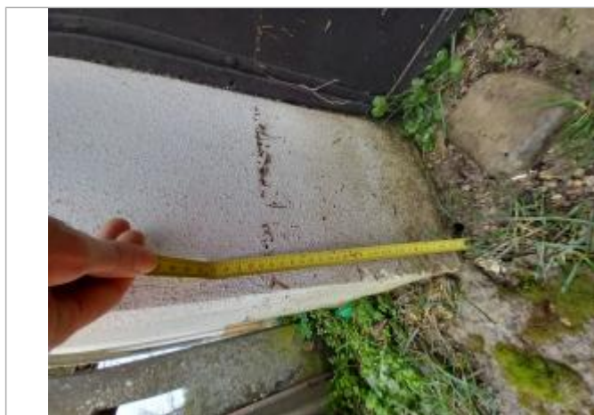
Mesure Laisse de crue