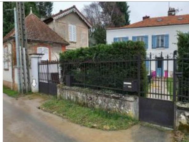
Maison d'habitation - Mesure effectuée au niveau du portail (Poteau béton gauche)