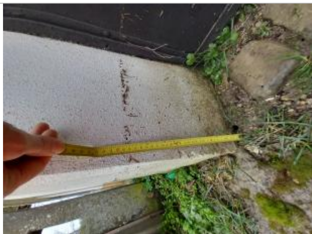
Mesure Laisse de crue