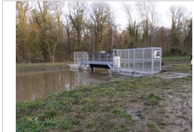
Ecluse du grand dam

Coordonnées WGS84 : X: 2.59416604 / Y: 50.67532680