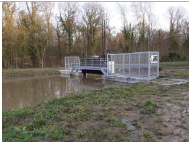
Ecluse du grand dam