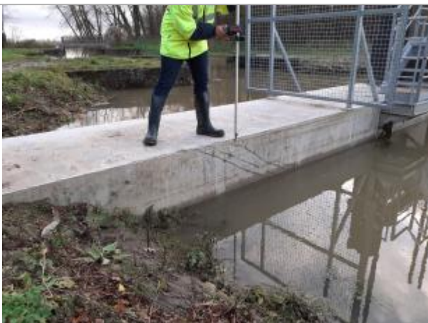
marque sur le rebord

Altitude calculée de l'eau (en m) : 17.27 m