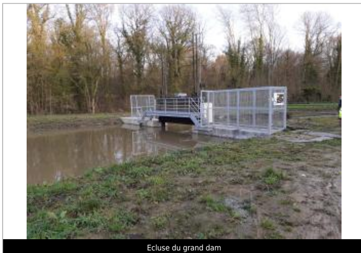
Ecluse du grand dam

GÉOLOCALISATION Coordonnées WGS84 : X: 2.59416604 / Y: 50.67532680 Coordonnées RGF93 (Lambert 93) X: 671263 / Y: 7064349 Coordonnées RGF93 (ETRS89) : X: 2.594166 / Y: 50.6753268 Code Hydro: E3650850 Rive de référence: