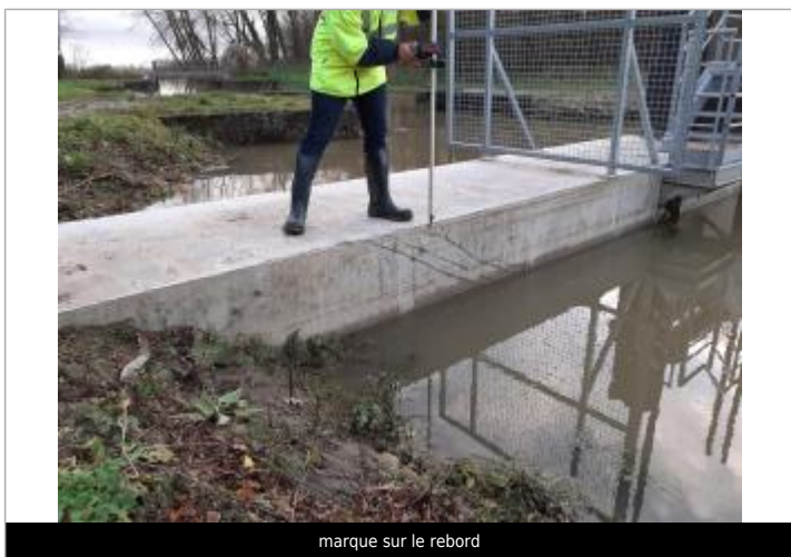
marque sur le rebord

MARQUE Maximum de l'inondation : Non renseigné Visibilité : Oui État du repère : Bon Pérennité : Aucune