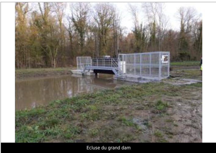
Ecluse du grand dam

GÉOLOCALISATION Coordonnées WGS84 : X: 2.59416604 / Y: 50.67532680 Coordonnées RGF93 (Lambert 93) X: 671263 / Y: 7064349 Coordonnées RGF93 (ETRS89) : X: 2.594166 / Y: 50.6753268 Code Hydro: E3650850 Rive de référence: