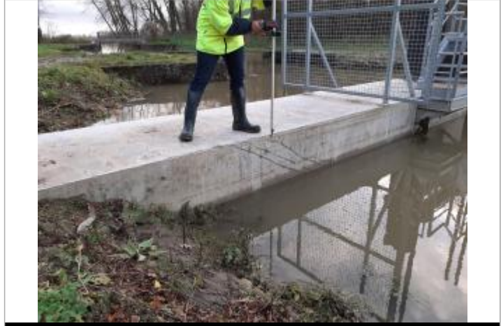
marque sur le rebord

MARQUE Maximum de l'inondation : Non renseigné Visibilité : Oui État du repère : Bon Pérennité : Aucune