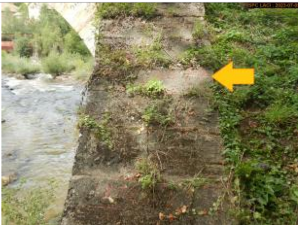
Vue du repère en 2023

Type de repérage : Campagne de terrain post-inondation