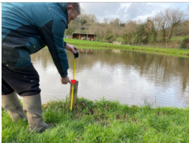
Poteau bois en bordure de l'étang de pêche

Altitude calculée de l'eau (en m) : 117.94 m