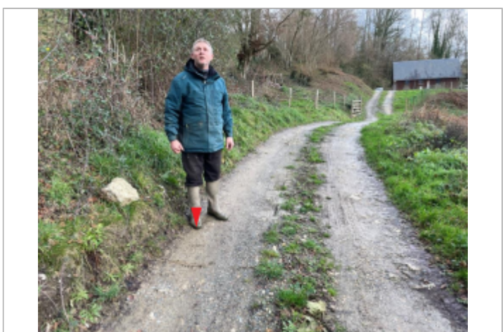
Localisation du niveau au pied de la personne, environnement lointain avec vue de la maison

MARQUE Maximum de l'inondation : Oui Visibilité : Oui État du repère : Bon Pérennité : Aucune Repère calculé : Non PHEC : Oui