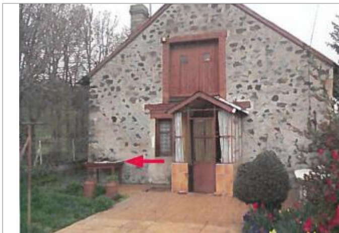
Vue du site en 2013

Coordonnées WGS84 : X: 2.93266454 / Y: 45.23220240