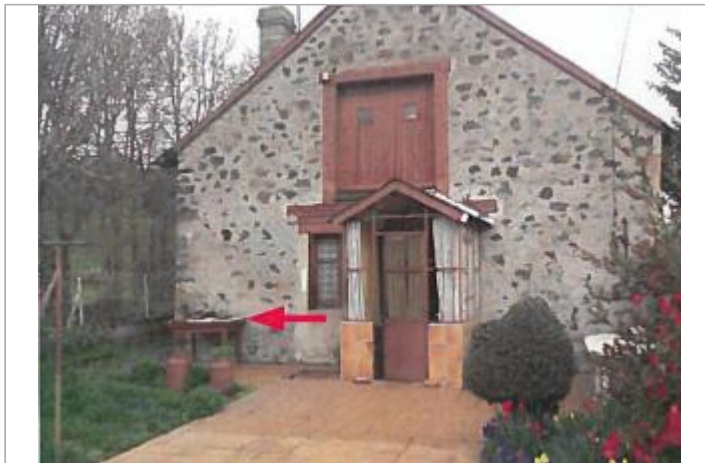
Vue du site en 2013