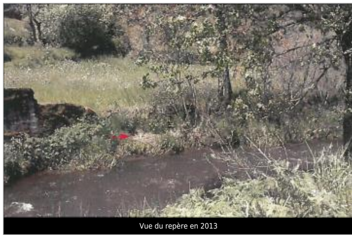
Vue du repère en 2013

Altitude calculée de l'eau (en m) : 969.79 m