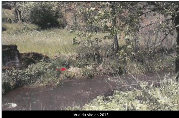
Vue du site en 2013

Coordonnées WGS84 : X: 2.93294139 / Y: 45.23060780