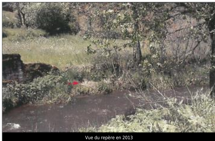
Vue du repère en 2013

Type de repérage : Campagne de terrain post-inondation