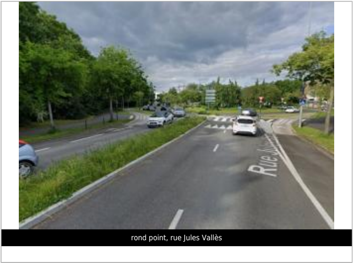
rond point, rue Jules Vallès