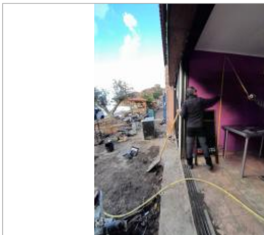
Vue du site, DDT2A, 2023

Coordonnées WGS84 : X: 8.69468443 / Y: 42.26687600