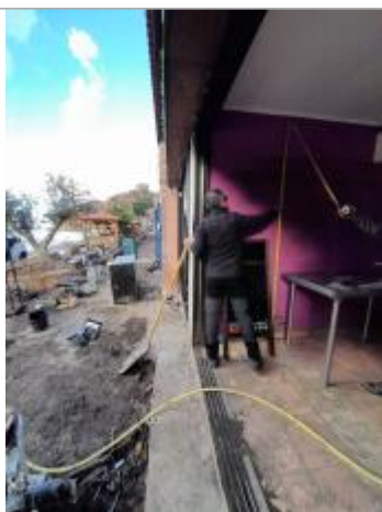
Vue rapprochée du repère, DDT2A, 2023