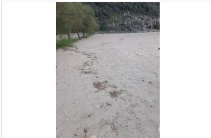
Vue du site, DDT2A, 2023

Coordonnées WGS84 : X: 8.69154863 / Y: 42.26412190