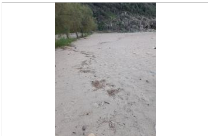
Vue de la laisse, DDT2A, 2023