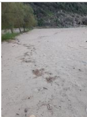
Vue de la laisse, DDT2A, 2023