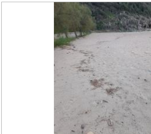
Vue du site, DDT2A, 2023

Coordonnées WGS84 : X: 8.69174299 / Y: 42.26429990